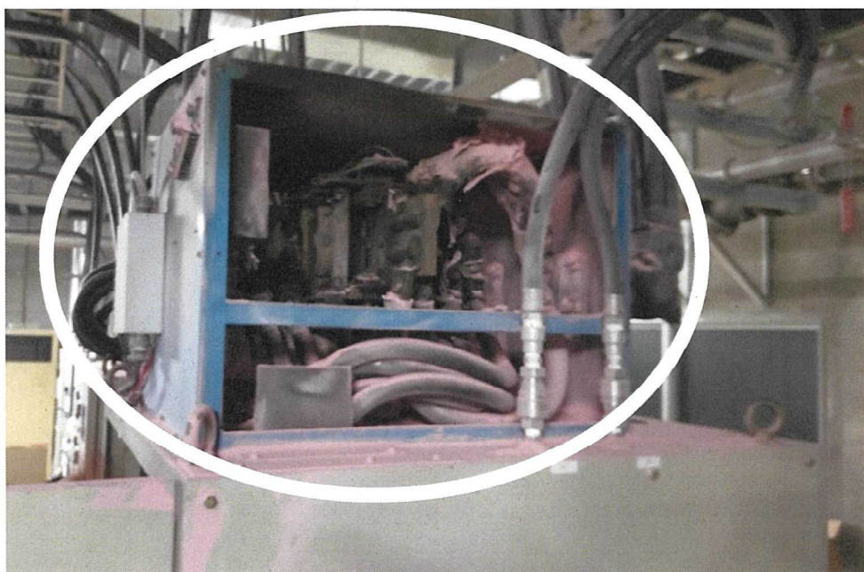
転極器右側面 (内部の様子)